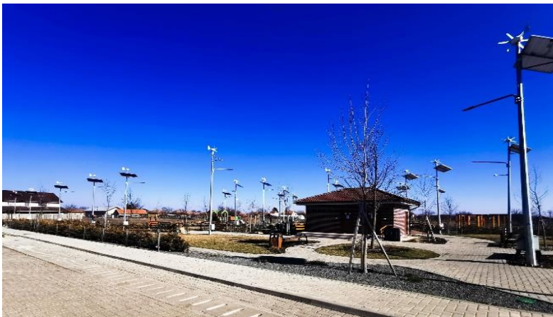
(Parcul de pe str. Bisericii, Giarmata-Vii)