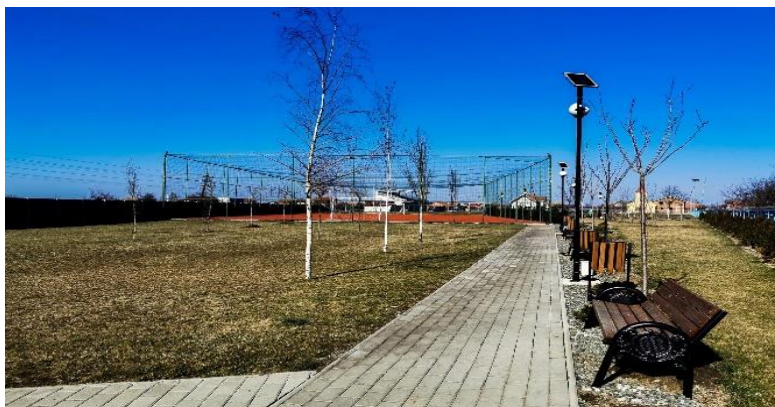
(Parcul de pe str. Islaz, Giarmata-Vii)