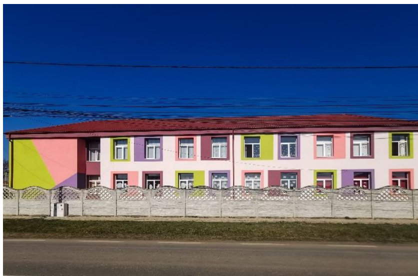
(Școala gimnazială Giarmata VII)

www.primariagheroda.ro ; registratura@primariagheroda.ro