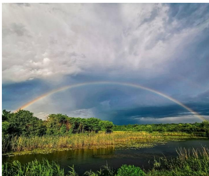
(Balta cu nuferi)