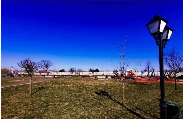
(Parcul de pe str. Stejarului Ghiroda)